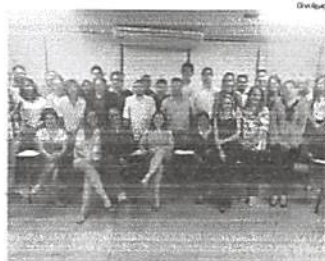
Micro e pequenos empresários industriais maranhenses beneficiados

inovação e gestão empresarial. Nesse período encontra 20 especialistas e 20 colaboradores entre- ram presenciais para tratar sobre o tema "Planejamento Estratégico", onde os participantes foram convidados por um mediador especialista no assunto a criar ou atualizar o missão, a visão e os valores das empresas, além de traçar estratégias. O Instituto Cés- tivo também, do governo estadual, e vi-