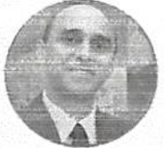
Cooperação visa ao fortalecimento da economia empreendedora